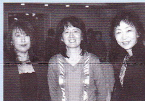
巖スマイル! 健在です