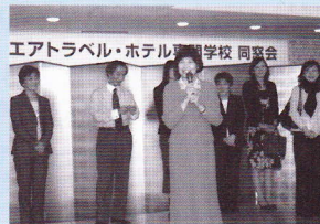
また元気にお会いできて嬉しいです