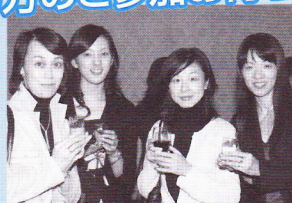
エアトラ教員も若返り!?