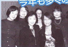
巖先生を囲んでパチリ!