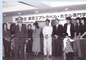
高田馬場の卒業生!