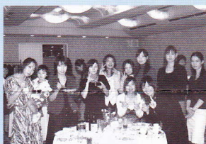
女子はいつも華やか