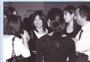
ツッチーは嬉しそう!