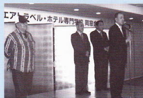
同窓会事務局のメンバー

昨年も沢山のエアトラ同窓生の皆さんがお集まり下さいました。 今年も多くの方で参加お待ちしております。